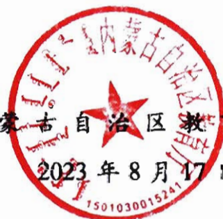
内蒙古自治区教育厅