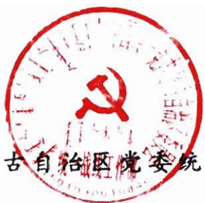
内蒙古自治区党委统战部

好第 40 个全区民族团结进步活动月工作，自治区党委统战部、宣传部，自治区民委、教育厅联合制定了《第 40 个全区民族团结进步活动月工作方案》，现印发给你们，请结合实际，认真组织实施。